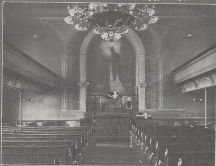
VIEW OF CHURCH INTERIOR