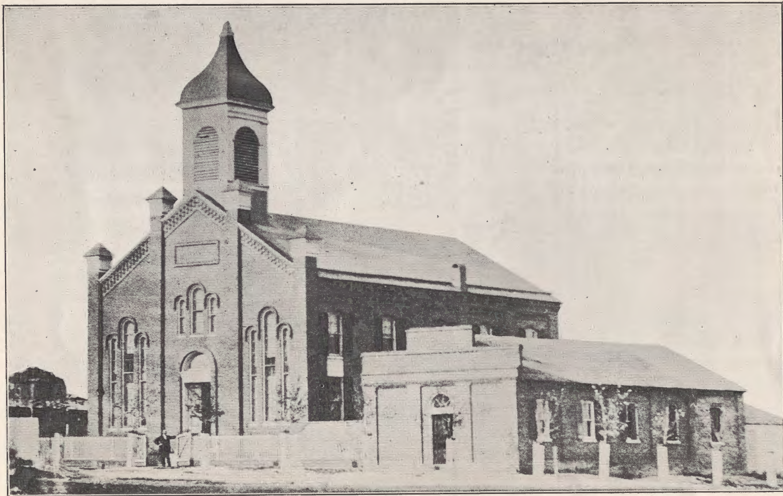
The Church and School Building in 1874