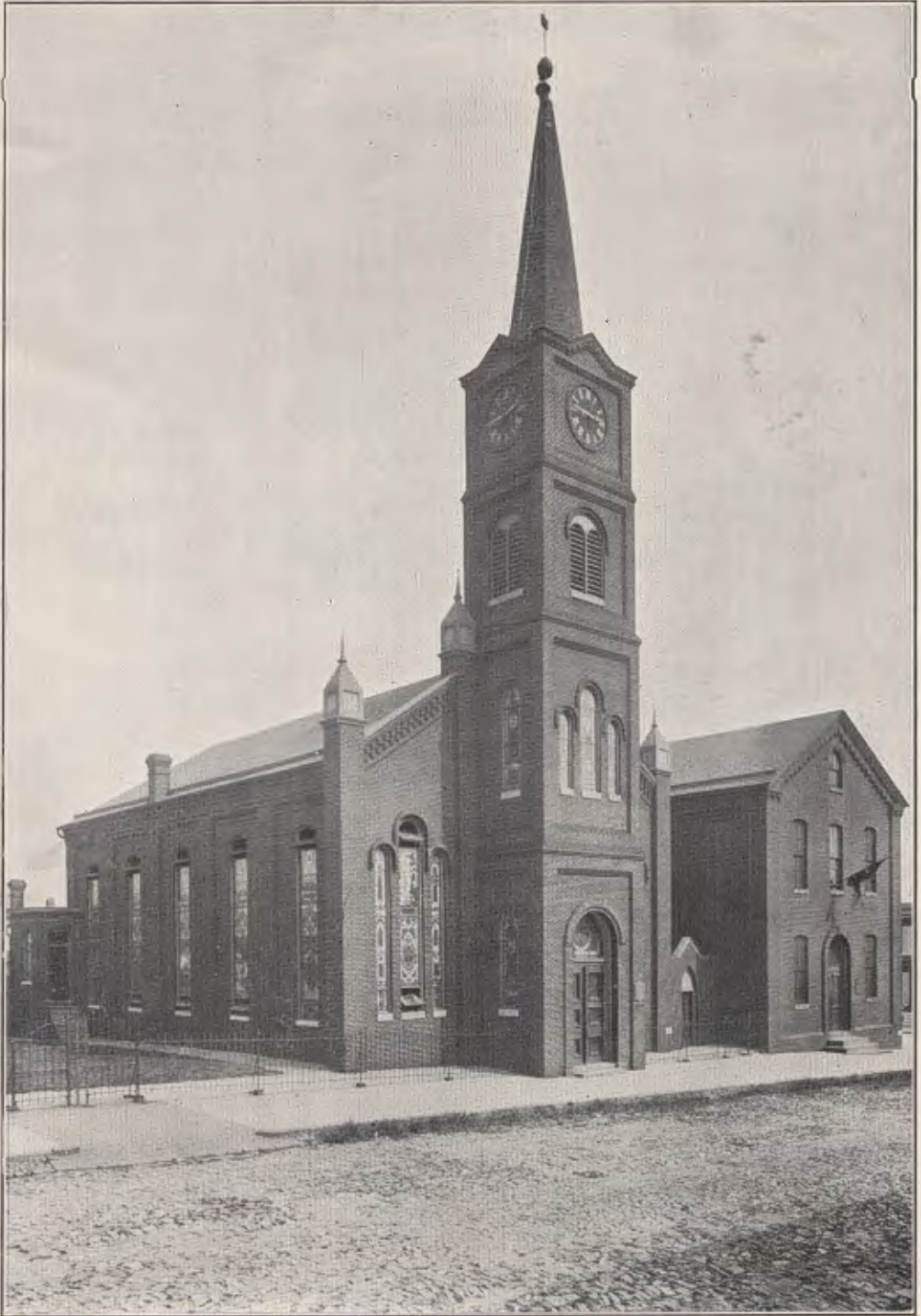
The German United Evangelical Church East Avenue and Dillon Street